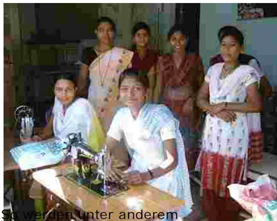
So werden unter anderem

Dieser Verein unterstützt in vielen Projekten die Entwicklungsarbeit in Zentralindien